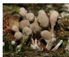
Trémelle du hêtre